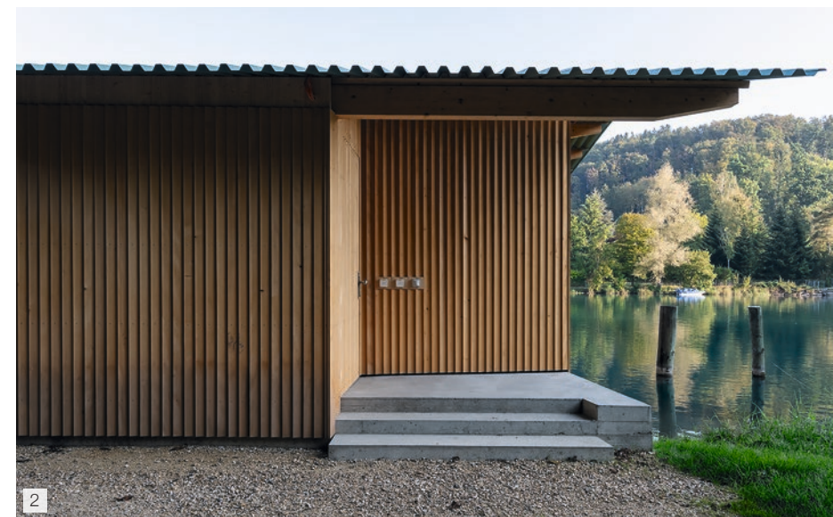
2 Der unter dem ausladenden Stahlprofilblechdach eingezogene Eingangsbereich.