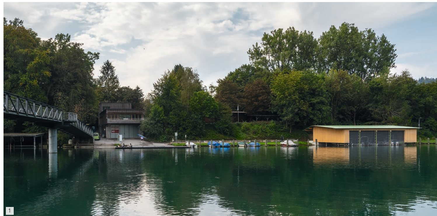
1 Das Ensemble der Holzbauten beim Stägmattsteg: das Gebäude des Rowing Clubs, des Fischervereins und das neue Bootshaus KAPO Bern.

Durch den Neubau wurden schützenswerte Lebensräume überbaut oder beeinträchtigt. Die daraus entstehende Ersatzpflicht wird durch den Rückbau des alten Bootshauses und die anschliessende Renaturierung des Grundstücks in der Ey (Gemeinde Wohlen) vollumfänglich erfüllt. Die Zusammenarbeit der verantwortlichen Stellen von Kanton und Stadt, Umweltorganisationen und der am Bau Beteiligten haben eine Lösung ermöglicht, die dem Naturschutz adäquat Rechnung trägt.